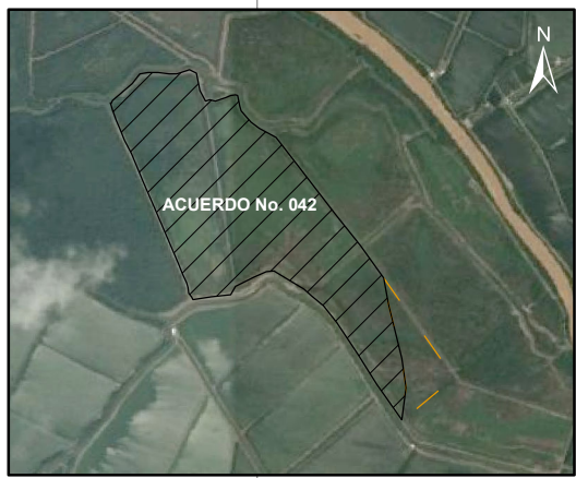
IMAGEN SATELITAL GOOGLE EARTH